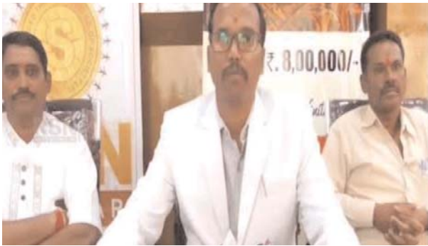
సంగారెడ్డి ప్రతినిధి (ప్రజాపాలన) సంగారెడ్డి, డిసెంబర్ 16: అధిక వడ్డీల ఆశచూపి అమాయకుల నుంచి భారీ మొత్తంలో పెట్టుబడులను పొందిన సన్