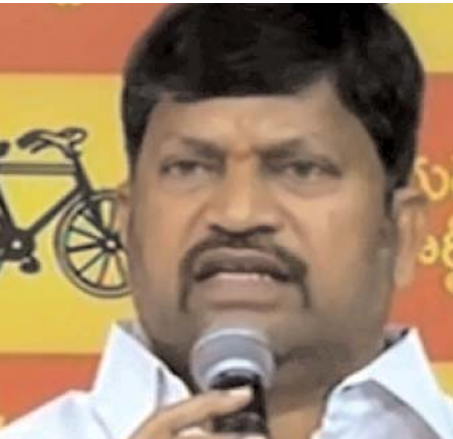
హైదరాబాద్ (ప్రజాపాలన): దేశ రాజకీయాల్లో పెను